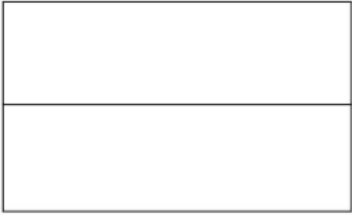
První československá vlajka